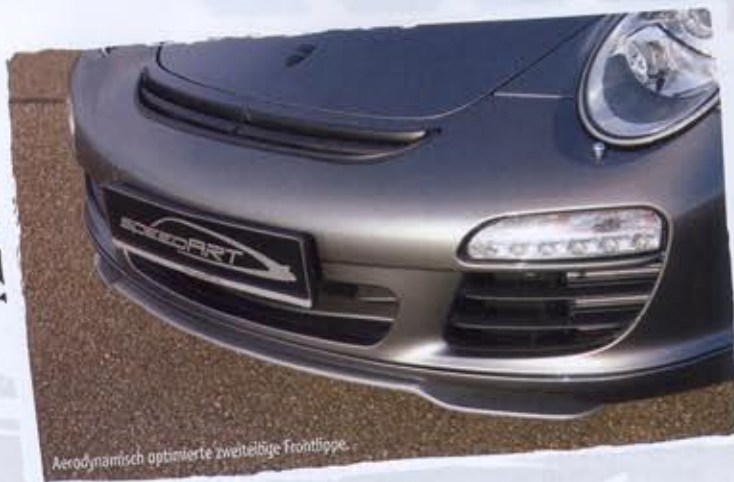
Aerodynamisch optimierte zweiteilige Frontlippe.