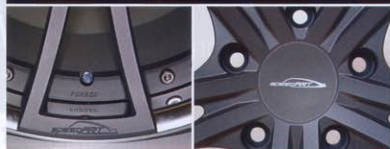
speedART LSC FORGED 20"-Rad, 3-teilig mit geschmiedetem Stern für Porsche-Modelle