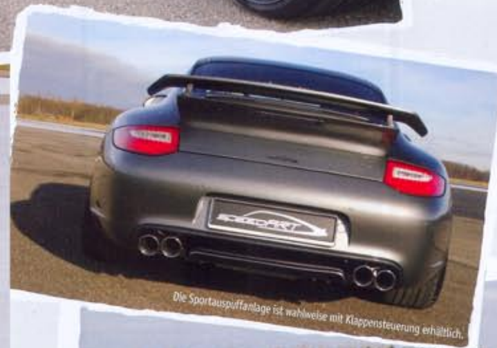
Die Sportauspuffanlage ist wahlweise mit Klappensteuerung erhältlich.

Damit dieser 997er auch bei der Kurven-Performance gewinnt, verbaut speedART je nach Vorliebe des Lenkers einen besonders leichten geschmiedeten Felgensatz mit dem Name LSC Light Spoke Competition in 20 Zoll und erfüllt alle Sportfahrwerkswünsche von komfortabel zart bis sportlich hart.