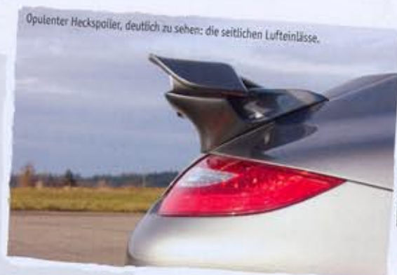
Opulenter Heckspoiler, deutlich zu sehen: die seitlichen Lufteinlässe.